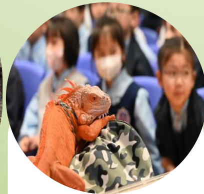
創造嶄新 奇趣經歷