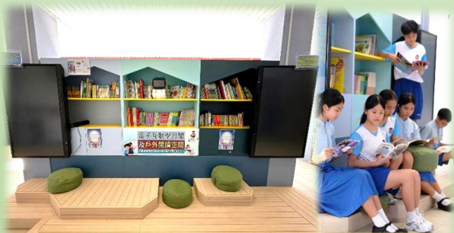
電子互動學習閣及戶外閱讀空間