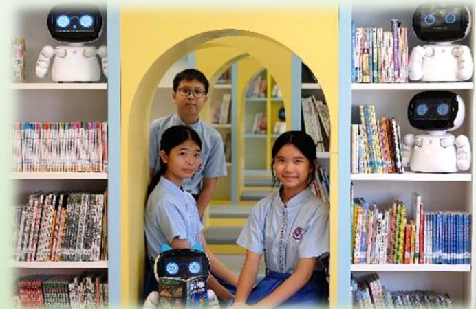
AI英語自學資源中心暨圖書館