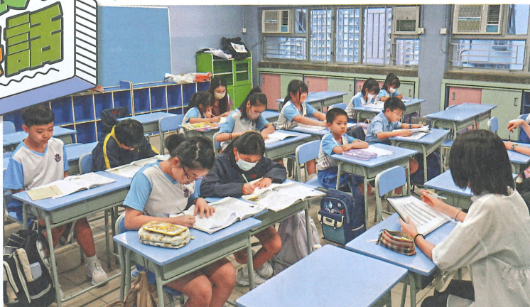
● 蕭校長坦言託管服務的確有助收生，但更重要的是顧及家長的需要。