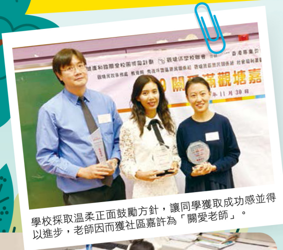
學校採取溫柔正面鼓勵方針，讓同學獲取成功感並得以進步，老師因而獲社區嘉許為「關愛老師」。